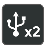
双 USB 接口